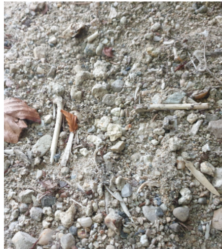
Zahlreiche Knochenreste von Beutetieren in einer Uhu-Brutnische

Stelle vermuten wir eine Baumbrut. Bis vor wenigen Jahren ging man noch davon aus, dass Uhus in unserer Region nur am Boden und im Fels brüten.